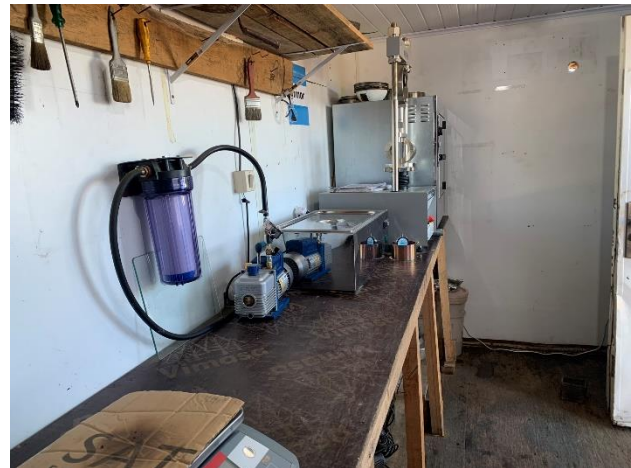
Foto 12.1-6, P05. Obrador, Laboratorio de suelos y asfaltos.