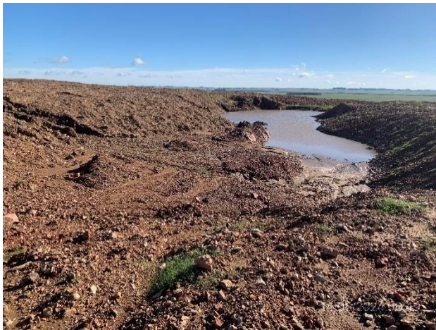
Foto 12.1-13, P07. Cantera de tosca, Ruta 27 progresiva 92K000 a (-), padrón N°7629 de la 6ª S.C. de Rivera.