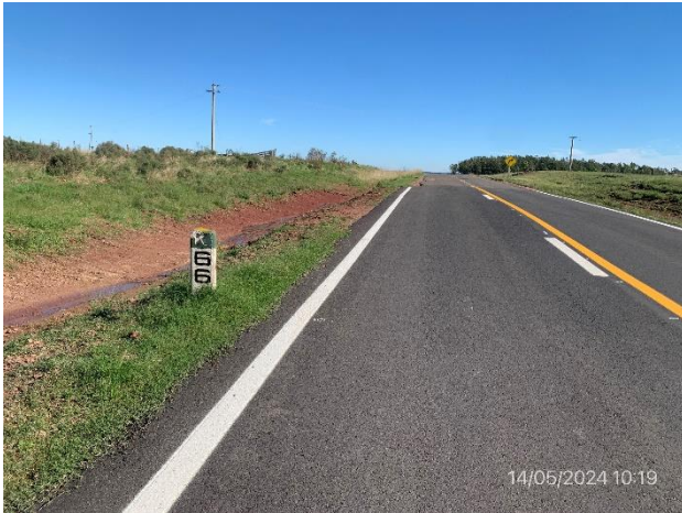
Foto 12.2-1, P01. Inicio de tramo, Ruta 27 progresiva 66K000.