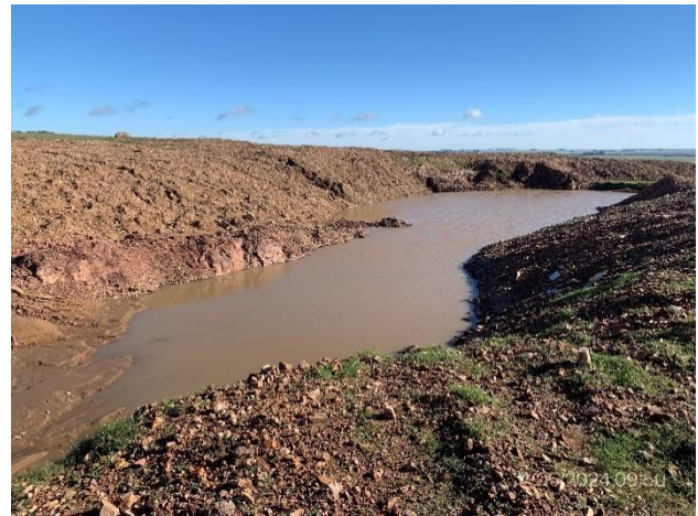
Foto 12.1-14, P07. Cantera, taludes adecuados en frente de explotación.