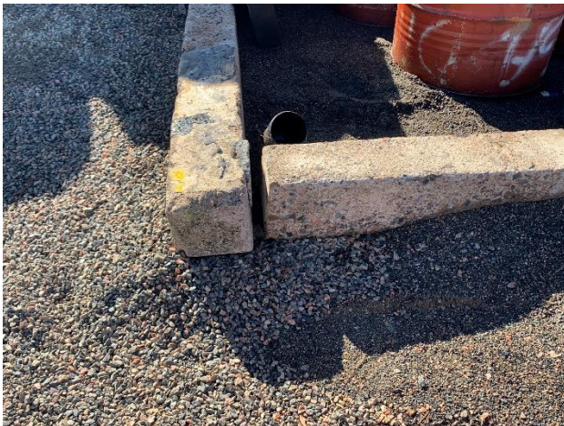
Foto 12.1-5, P05. Obrador, el envallado no cumple su función al estar perforado.