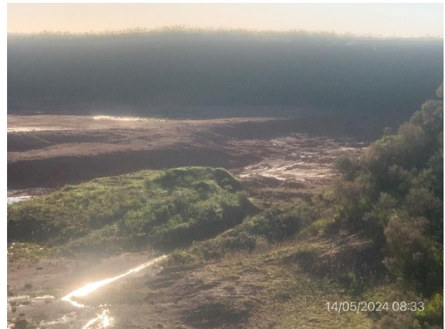
Foto 12.1-12, P06. Frente de explotación recubierto con suelo natural.