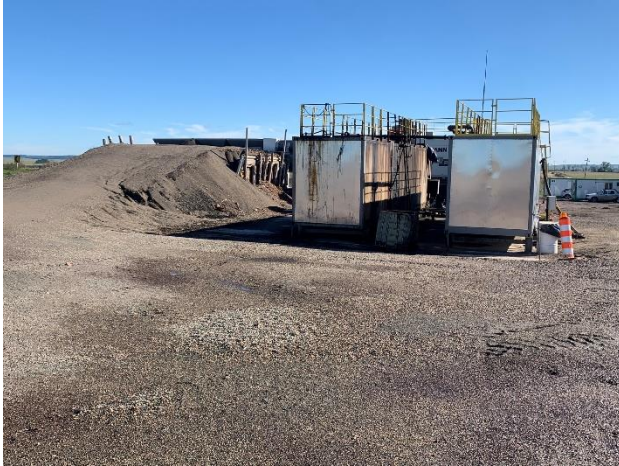
Foto 12.1-1, P05. Obrador y Planta asfáltica de Grinor SA. Faja Pública de Ruta 27 progresiva 61K100 a (-).