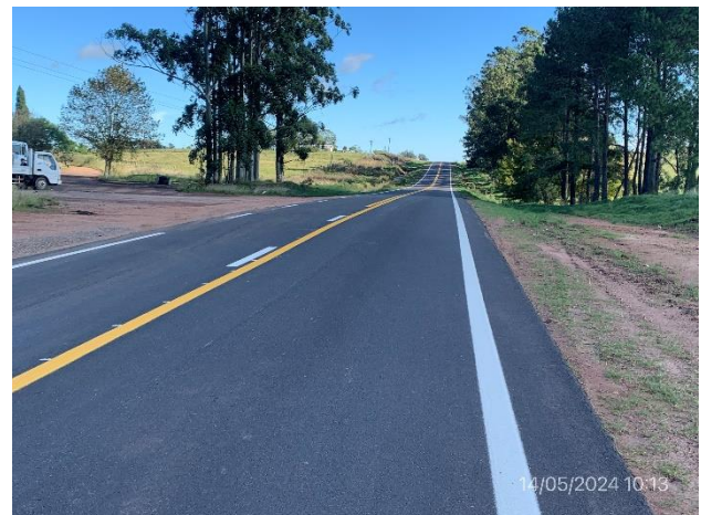
Foto 12.2-4, P02. Fin de tramo. Ruta 27 progresiva 75K000.