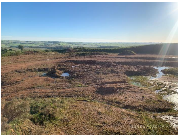
Foto 12.1-9, P06. Cantera de tosca, Ruta 6 progresiva 395K500 a (+), padrón N°13104 de la 8ª SC de Rivera.