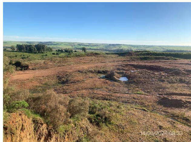
Foto 12.1-10, P06. Explanada granular permanece como eventual mejora a beneficio del propietario.