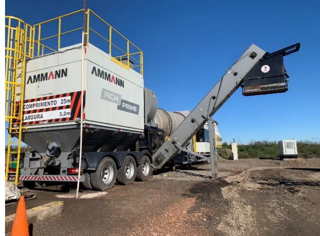
Foto 12.1-2, P05. Planta asfáltica sin actividad