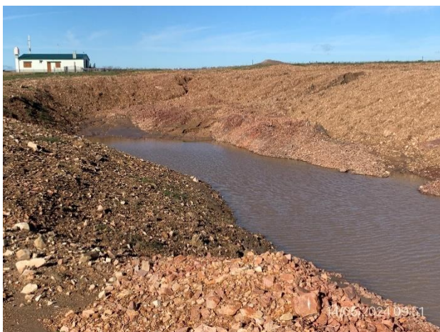
Foto 12.1-15, P07. Cantera, tajamar natural queda eventualmente como mejora a beneficio del propietario.