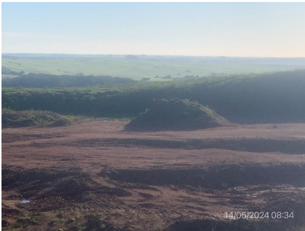
Foto 12.1-11, P06. Acopio de material granular permanece como eventual mejora a beneficio del propietario.