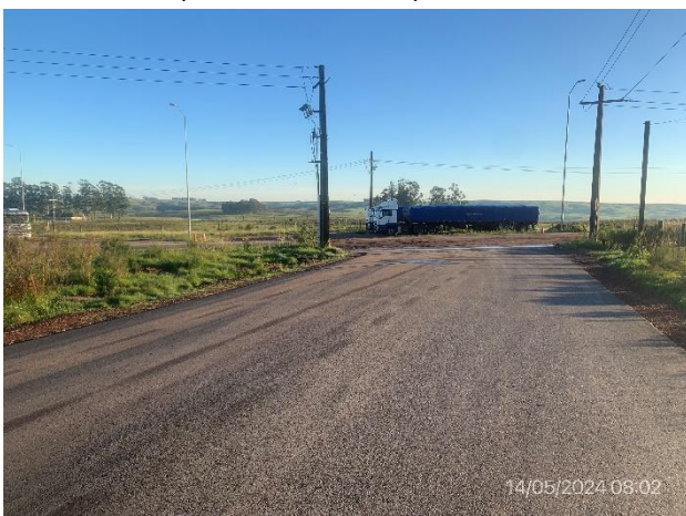
Foto 12.2-5, P03, Inicio de tramo ,Ruta 6 progresiva 393K420. Acceso Norte al desvío de tránsito pesado en Vichadero. Empalme con Ruta 27.