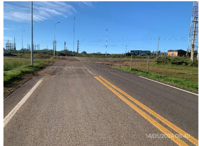
Foto 12.2-8, P04. Fin de tramo, Ruta 6 progresiva 392K500. Acceso Sur al desvío de tránsito pesado en Vichadero.