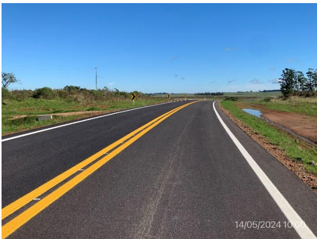
Foto 12.2-3, Ruta 27, faja pública con pendientes suaves que favorecen el empastado .