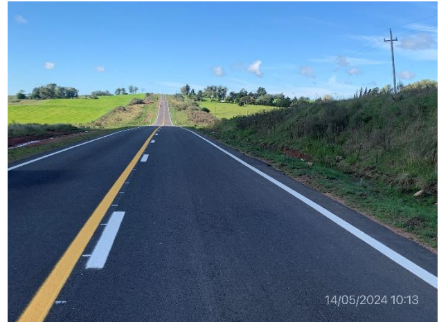
Foto 12.2-2, Ruta 27. Carpeta de rodadura y obras de señalización horizontal terminadas.