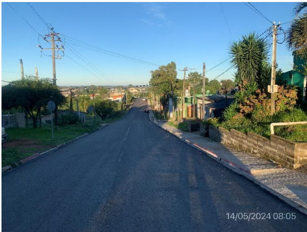
Foto 12.2-7, Vichadero. Desvío de tránsito pesado terminado.