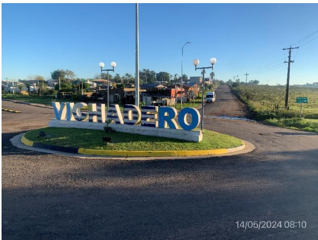
Foto 12.2-9, P04. Fin de tramo, Ruta 6 progresiva 392K500. Acceso Sur al desvío de tránsito pesado en Vichadero.