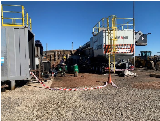
Foto 12.1-3, P05. Planta asfáltica sin actividad. No cuenta con envallado para prevención de derrames.