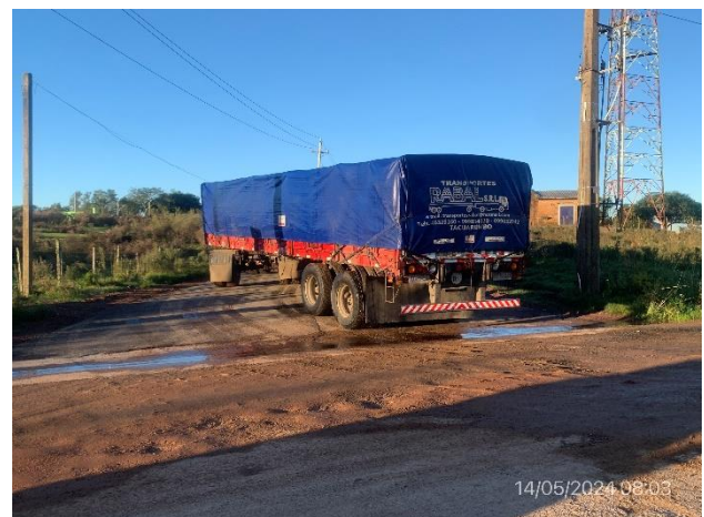
Foto 12.2-6, P03, Inicio de tramo ,Ruta 6 progresiva 393K420. Acceso Norte al desvío de tránsito pesado en Vichadero. Empalme con Ruta 27.