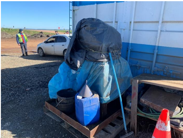
Foto 12.1-7, P05. Obrador, residuos de percolretileno usado acopiado en tarrinas tapadas y bandeja estanca.