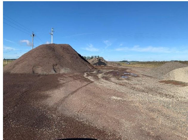
Foto 12.1-8, P05. Obrador, acopio de áridos permanecen en el predio.