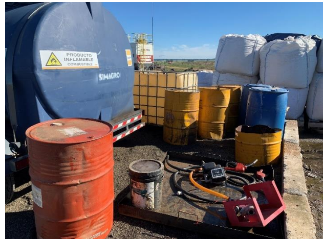
Foto 12.1-4, P05. Obrador, tarrinas y depósito de combustible en recinto con envallado defectuoso.