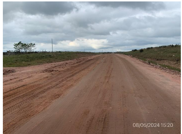
Foto 12.1-4. Ruta 19, recargo granular y bacheo en ejecución en calzada entera.