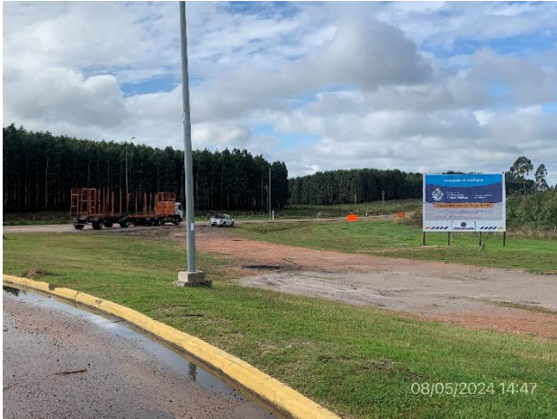
Foto 12.1-1, P01. Inicio de tramo de obras de Ruta 19. Ruta 19, progresiva 0K000, empalme con Ruta 14.