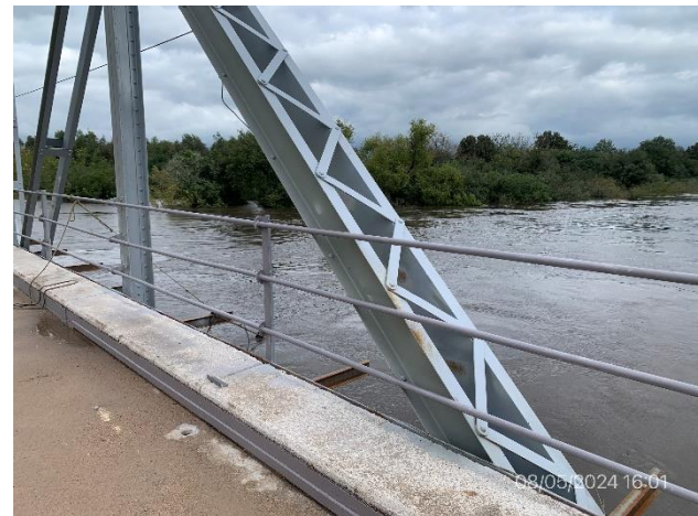
Foto 12.2-2, P05. Trabajos en ejecución de arenado y pintura en estructura metálica del puente.