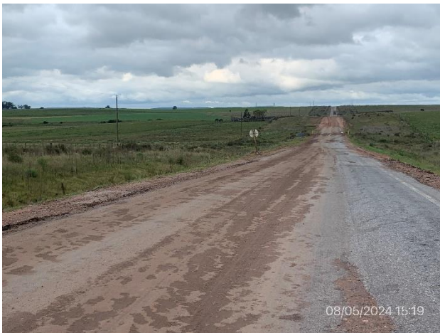
Foto 12.1-3. Ruta 19, recargo granular y bacheo en ejecución en media calzada.