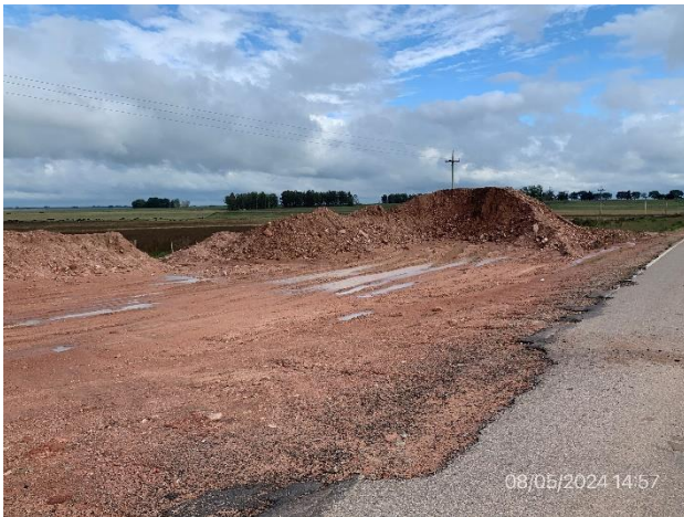
Foto 12.1-5, P06. Acopio de material granular. Faja pública de Ruta 19 a (+), progresiva 9K300