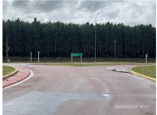
Foto 12.1-2, P01. Inicio de tramo de obras de Ruta 19. Ruta 19, progresiva 0K000, empalme con Ruta 14.