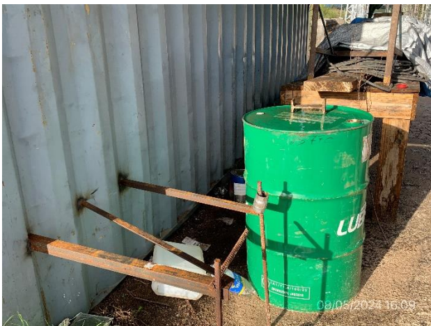
Foto 12.2-5, P05. Campamento provisorio, tarrina de combustible apoyada directamente en suelos desnudos sin barrera para contención de derrames.