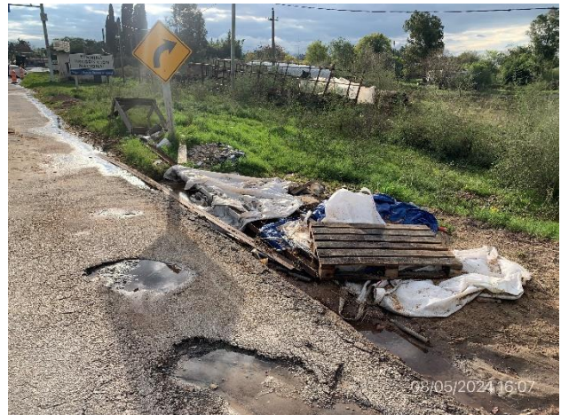
Foto 12.2-4, P05. Campamento provisorio. No se dispone de la infraestructura requerida para la correcta gestión de residuos.