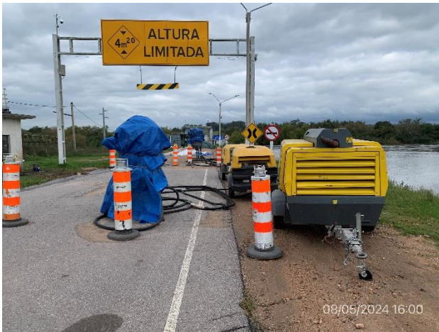
Foto 12.2-3, P05. Equipamiento de arenado en buenas condiciones. Compresores con bandejas internas de prevención de derrames