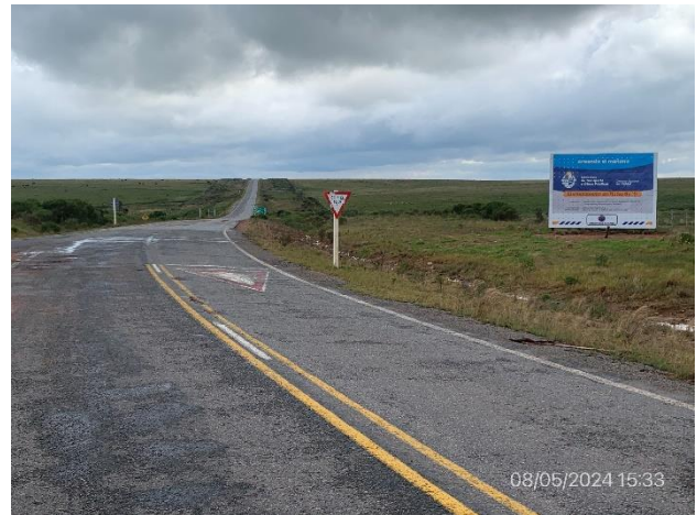
Foto 12.1-6, P04. Fin de tramo de obras a ejecutar Ruta 6. Ruta 6 progresiva 233K800, Casa Sainz..