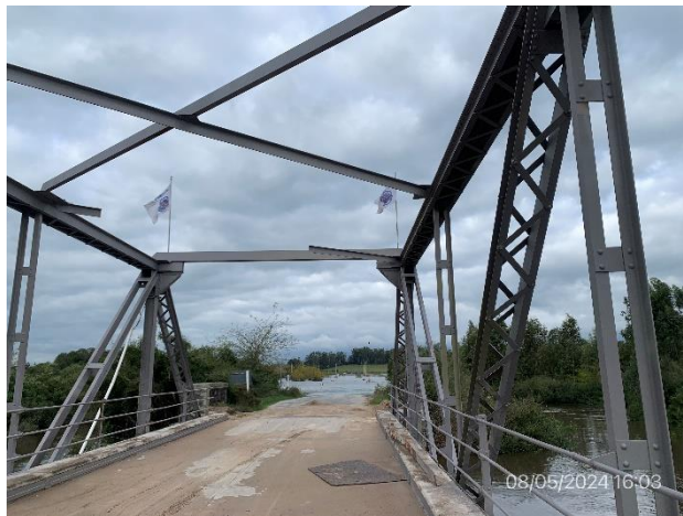
Foto 12.2-1, P05. Puente en obra sobre el Río Yí. Ruta 6 progresiva 200K800, Sarandí del Yí.