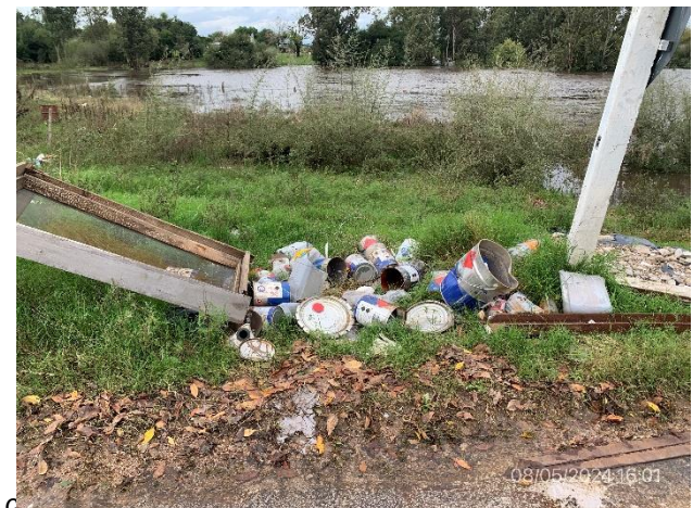
Foto 12.2-6, P05. Campamento provisorio, envases dispersos con restos de pinturas y solventes.