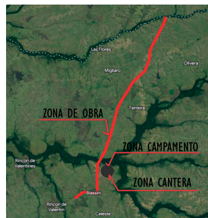
Zona de Obra / Zona de Obrador y Cantera