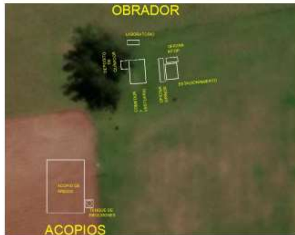
Ilustración 2. Croquis Obrador (2)

Quedamos a las órdenes para cualquier aclaración que requiera,