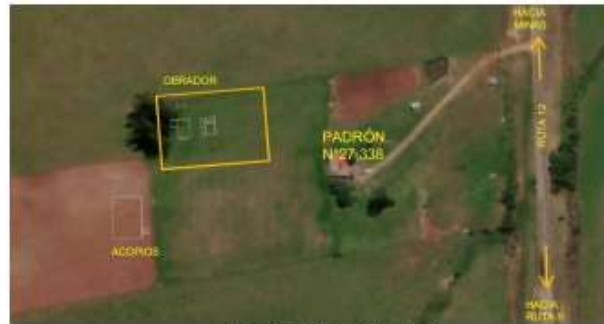
Ilustración 1. Croquis Obrador (1)

Se presenta a continuación un croquis del obrador.