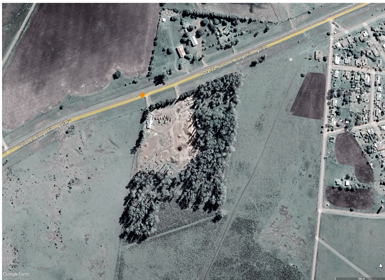
Imágen 2 - Ubicación y dimensiones del obrador

No se realizó instalación de obrador. Para la ejecución de las obras, fue utilizado el campamento de la Regional V de la Dirección Nacional de Vialidad, ubicado en Ruta N°31, progresiva 74k500, para acopio de material granular (polvo) y cisterna de emulsión asfáltica.