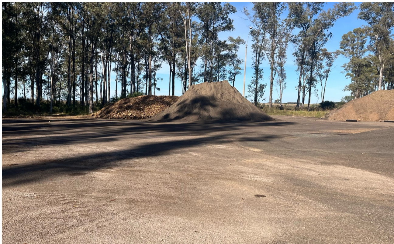
Imagen 4 – Acopio de polvo (aprox. 20m 3 )

A solicitud del encargado de distrito, fueron dejados acopios de agregado pétreo (polvo), para la utilización de este por parte de la Regional, para eventuales tareas de mantenimiento (aprox. 20 m 3 ).