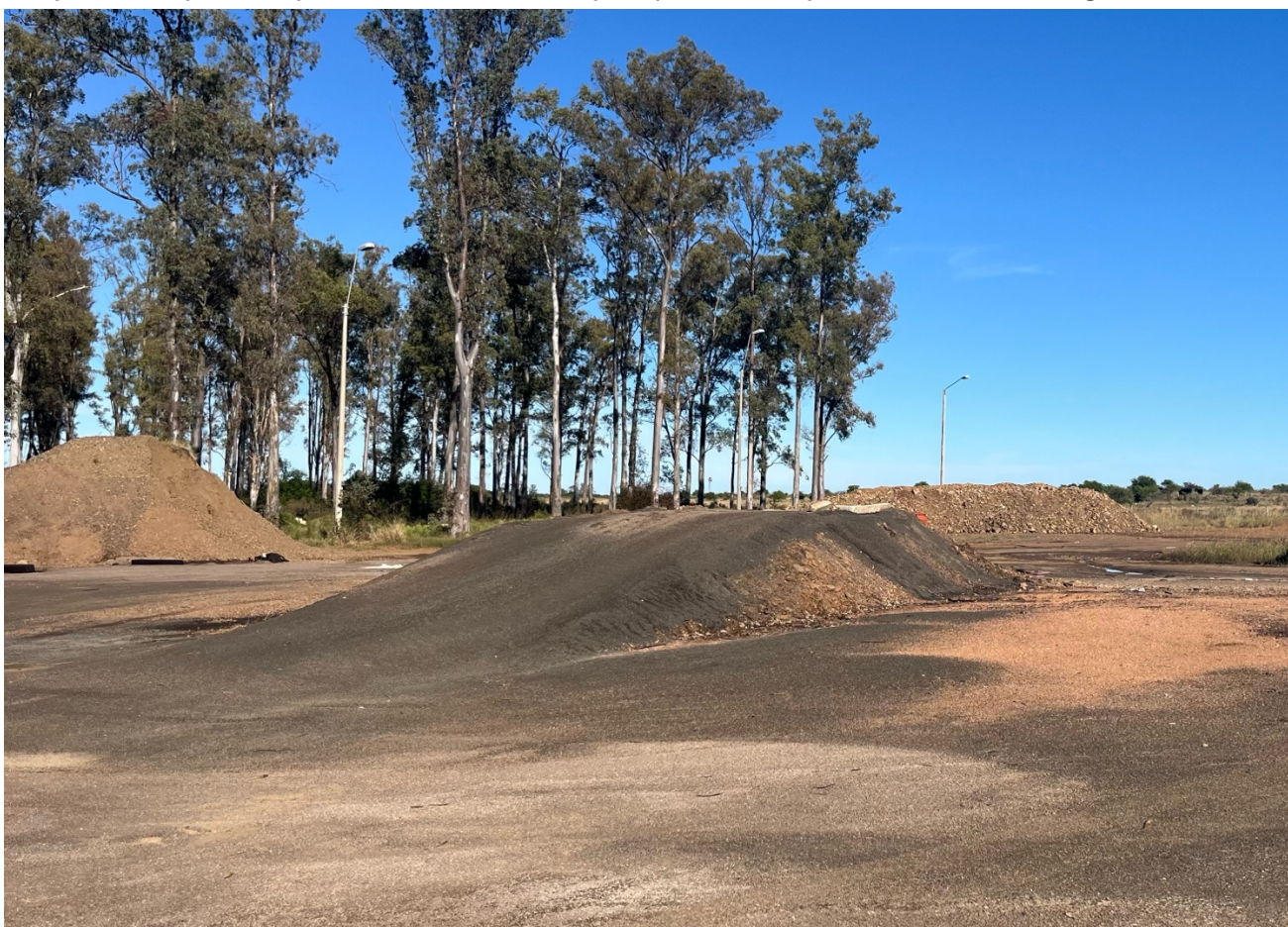
Imagen 3 - Rampa

Para la ejecución de las obras fue construida una rampa, que es dejada como mejora del predio para su utilización por parte del personal de la Regional.