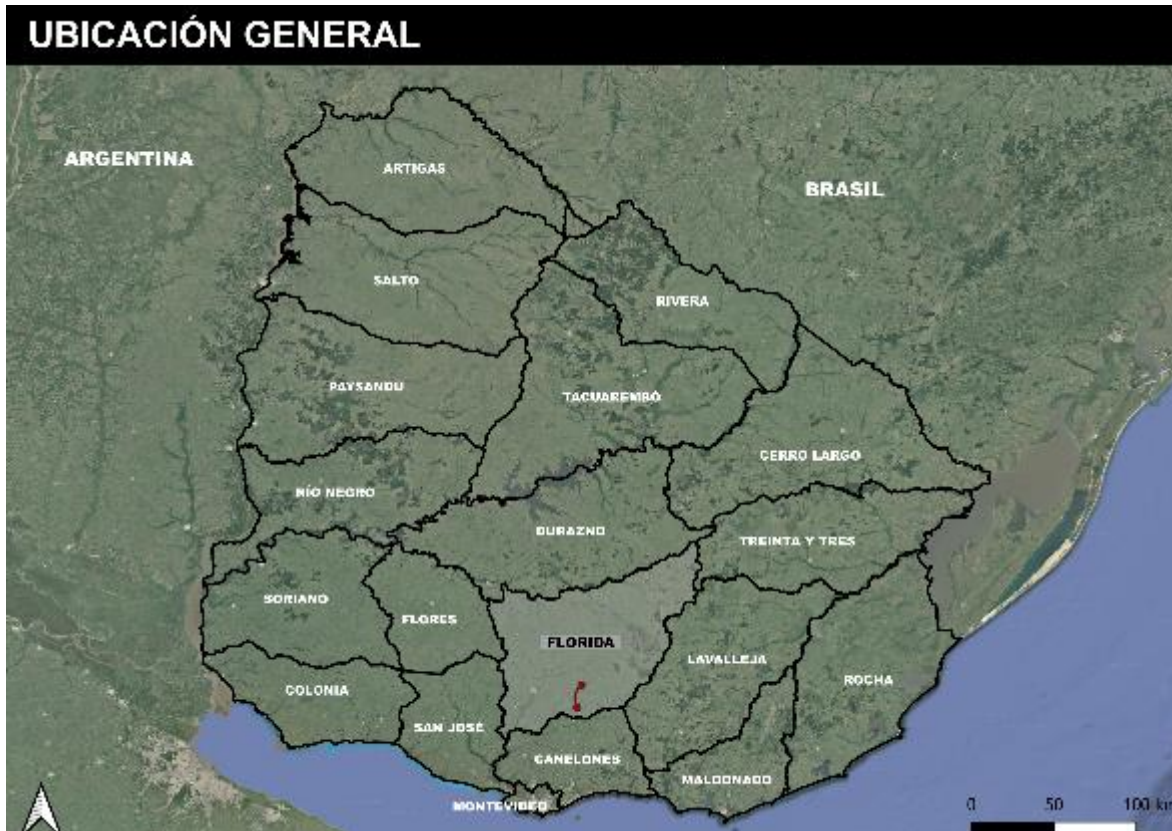
Figura 4-1 Ubicación de la obra.