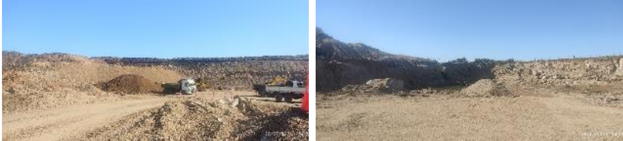
Foto 12.4-1 Vistas de Cantera Padrón 654.