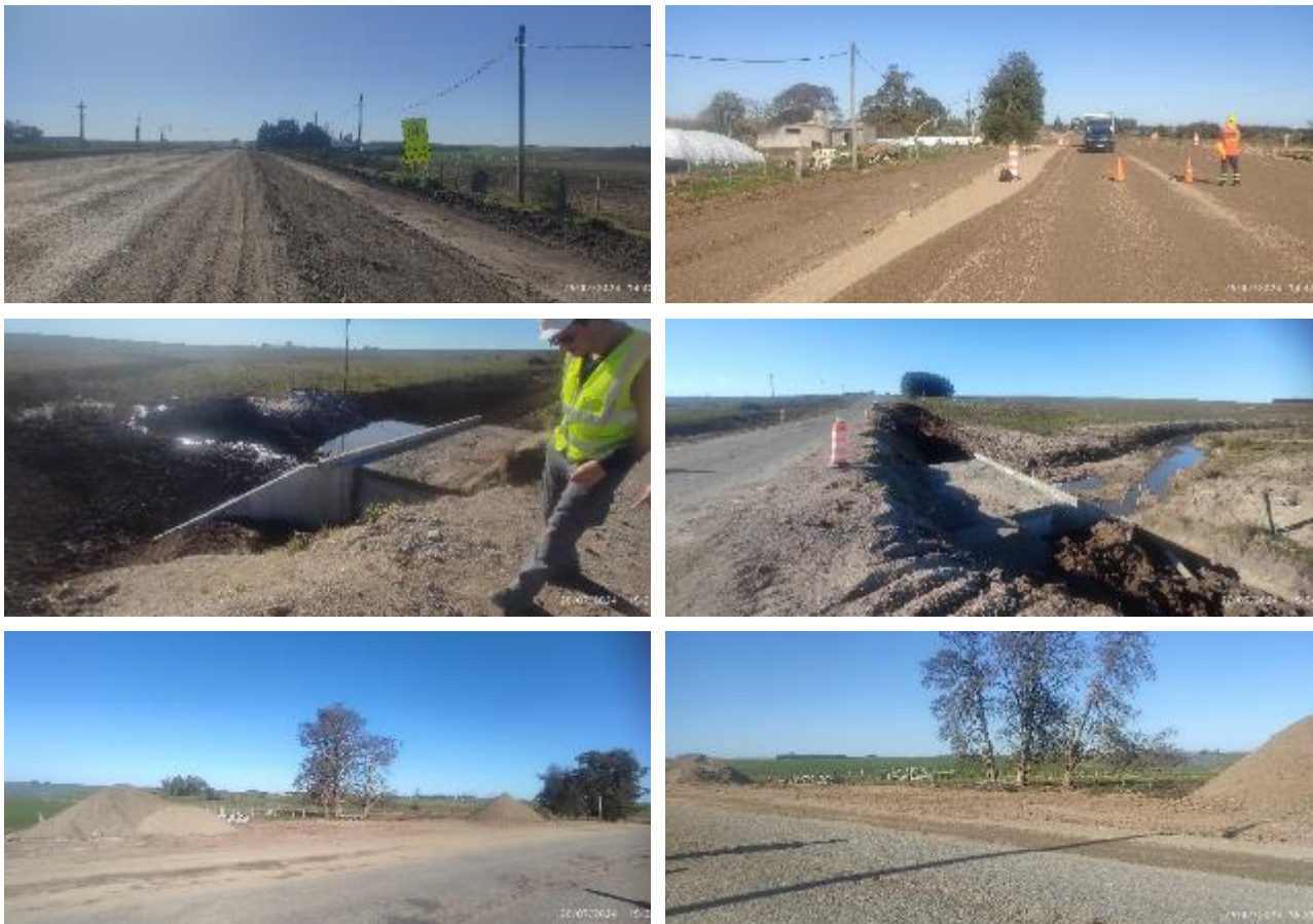
Foto 12.5-1 Vistas del tramo en obra.