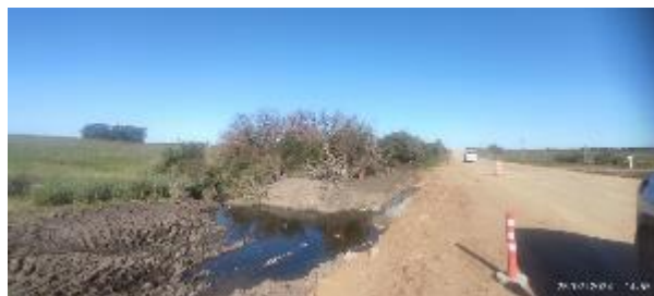
Foto 12.2-1 Regularización de entorno de alcantarilla sin cubierta vegetal.