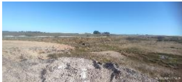
Foto 12.1-1 Erosión de material de explanada del obrador sobre cauce de agua cercano.