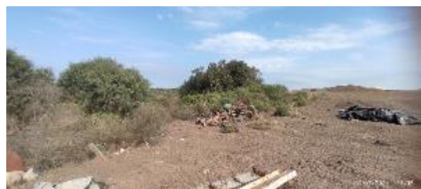
Foto 12.2-1 Residuos diseminados por el predio.