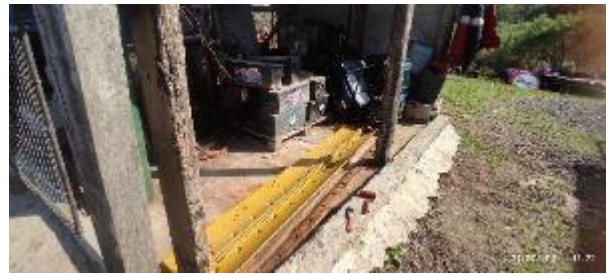
Foto 12.4-1 Estructura inadecuada de dique para hidrocarburos y residuos especiales.