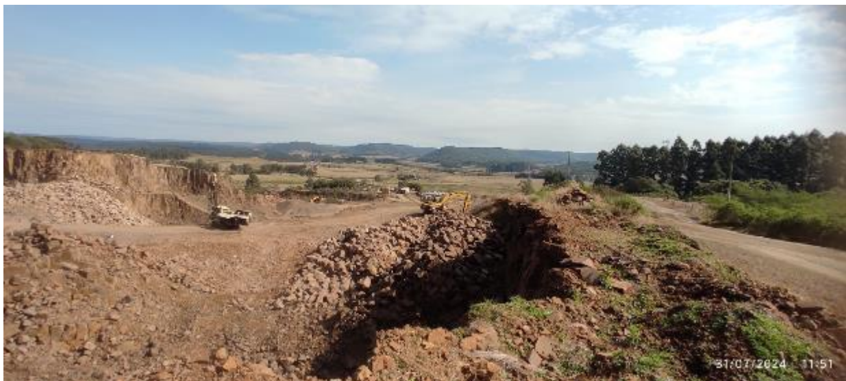
Foto 12.5-1 Barranco en cantera próximo a camino, sin señalizar.