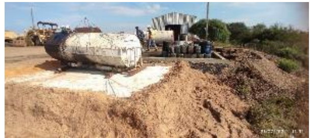
Foto 12.8-1 Vistas del Obrador.