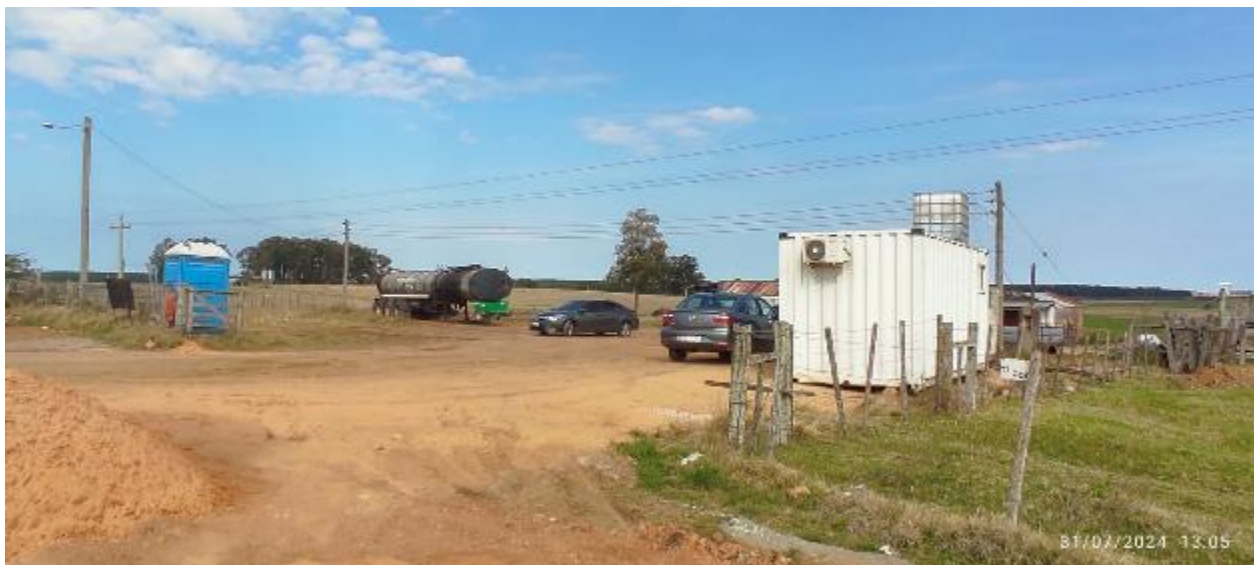
Foto 12.11-1 Obrador Auxiliar en Ruta 27.