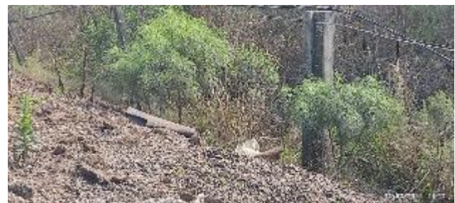
Foto 12.7-1 Cable sujeto de alambrado.