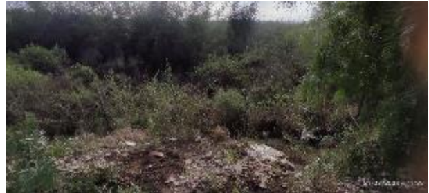
Foto 12.1-1 Derrames de hidrocarburo en el Obrador principal.