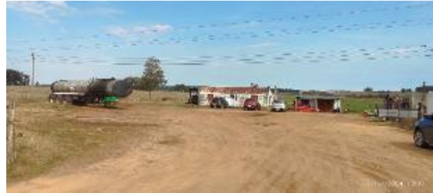
Foto 12.3-1 Vivienda próxima a Obrador Auxiliar.