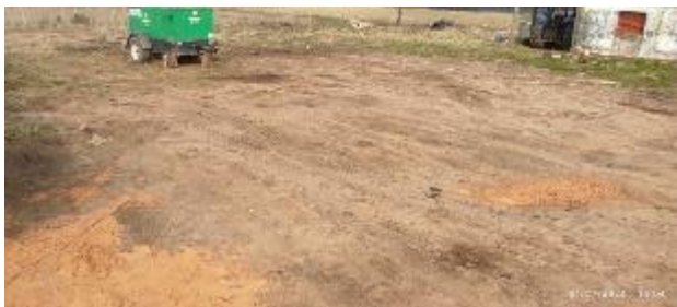
Foto 12.1-2 Derrames de hidrocarburo en Obrador Auxiliar.