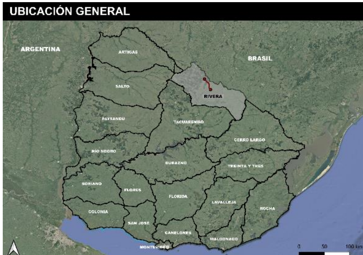
Figura 4-1 Ubicación general de la obra.