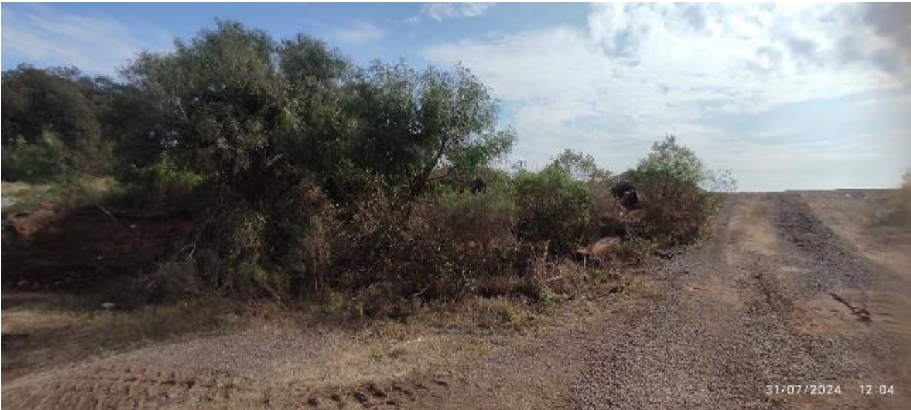
Foto 12.6-1 Residuos cubiertos por vegetación.