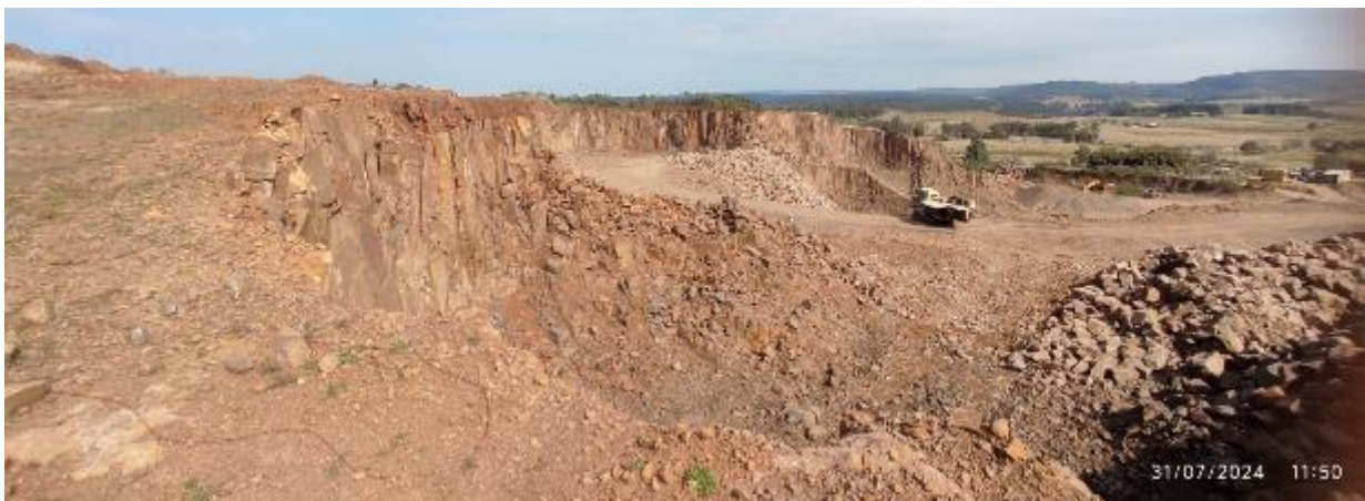
Foto 12.9-1 Frente de extracción cantera Padrón 13399.