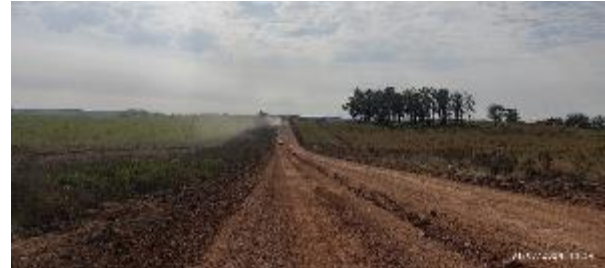
Foto 12.10-1 Vistas del tramo en obra.