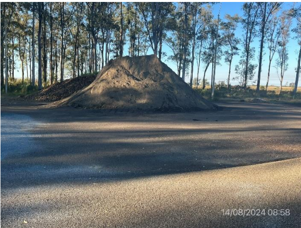
Foto 12.2-3, P03. Acopio de material granular, queda eventualmente como mejora a beneficio de DNV – MTOP, propietario del predio.