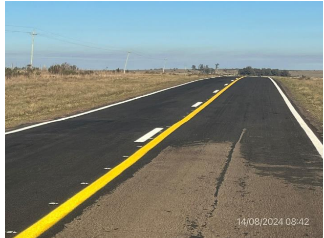
Foto 12.1-2, P02. Fin de tramo, Ruta 31, progresiva 94K000.