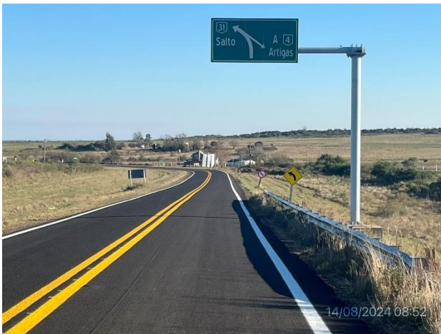
Foto 12.1-3, Ruta 31. Obras terminadas, señalización horizontal y vertical ejecutadas.