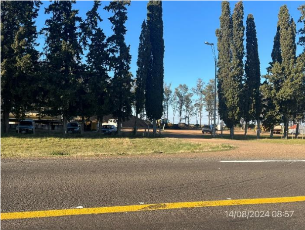
Foto 12.2-1, P03. Campamento provisorio abandonado, Regional V - MTOP. Ruta 31 progresiva 74K300 a (+).