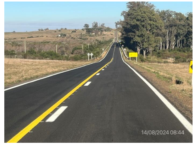
Foto 12.1-4, Ruta 31. Obras terminadas, nueva carpeta en Slurry Seal ejecutada. Faja publica en buenas condiciones de limpieza.