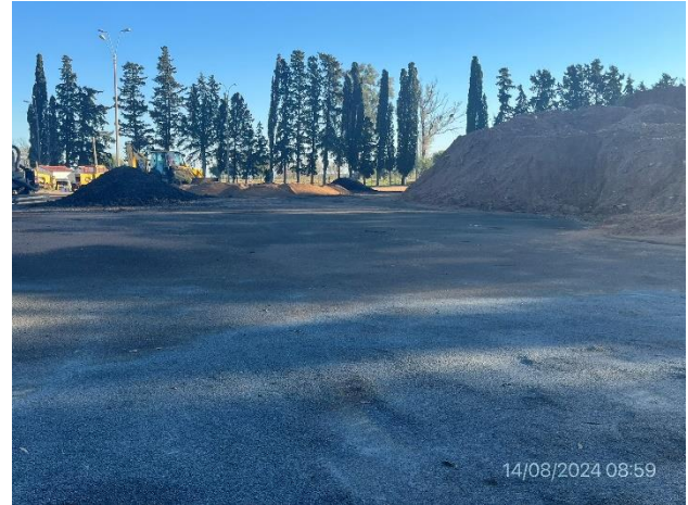
Foto 12.2-2, P03. Explanada de maniobras limpia, ordenada y libre de ROcs provenientes de la obra