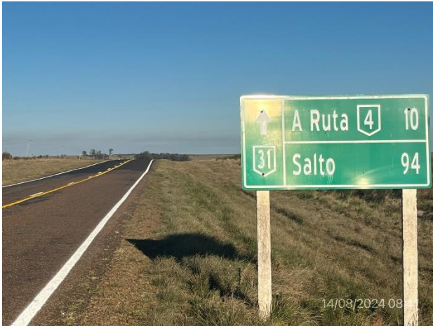
Foto 12.1-1, P02. Fin de tramo, Ruta 31, progresiva 94K000.