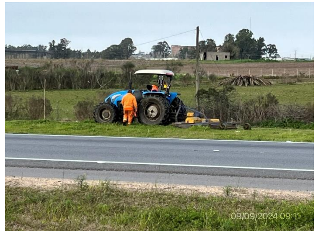
Foto 12.1-4, P05. Mantenimiento de áreas verdes en ejecución. Faja pública en buenas condiciones de limpieza.