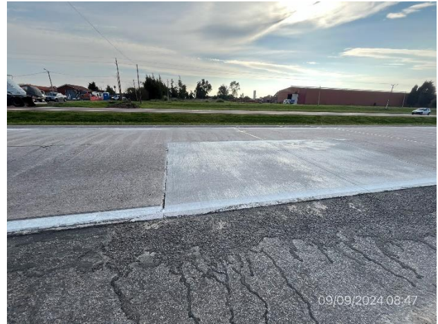
Foto 12.1-2, Obras terminadas en Ruta 1. Bacheo en hormigón terminado.