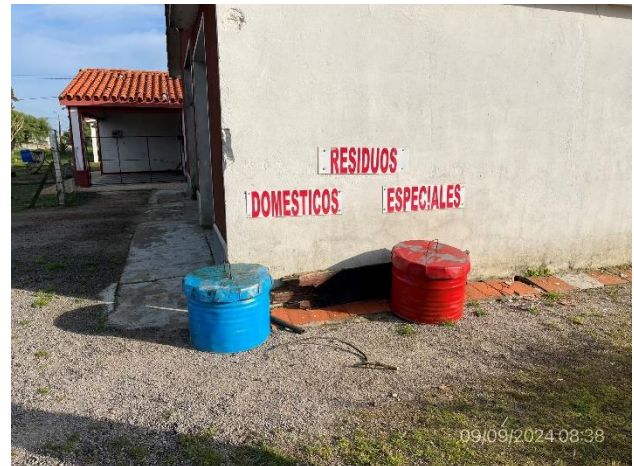
Foto 12.2-4, P03. Estación para acopio temporal de residuos segregados por corriente de generación.