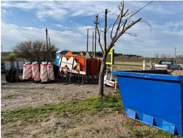
Foto 12.2-1, P03. Obrador Monerden SA. Padrón N°30, Localidad Catastral Cerámicas del Sur, Depto. de San José. Ruta 1 progresiva 37K900 a (+).