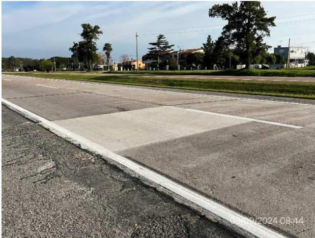
Foto 12.1-1, Obras terminadas en Ruta 1. Bacheo en hormigón terminado.