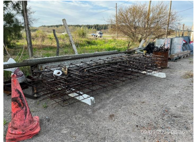
Foto 12.2-2, P03. Acopio de pasadores para baches en hormigón. Buenas condiciones de orden.