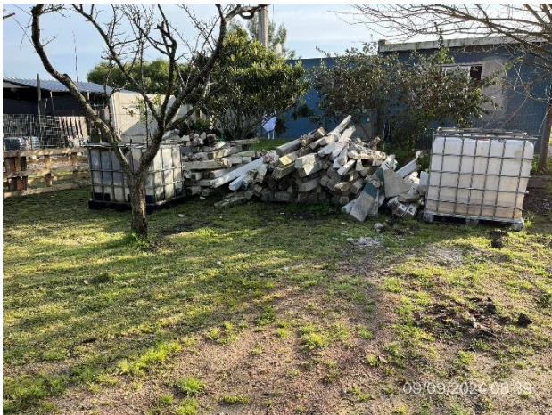
Foto 12.2-3, P03. Acopio de postes de hormigón.