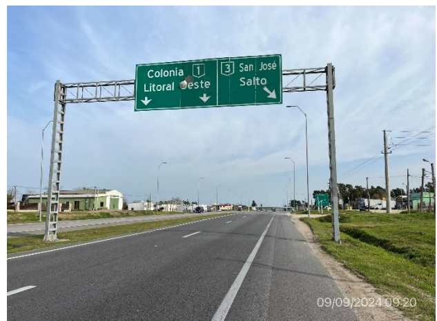
Foto 12.1-6, P02. Fin de tramo – Ruta 1 progresiva 67K600, empalme con Ruta 3.