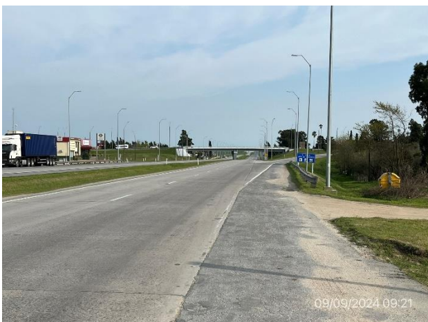
Foto 12.1-5, P02. Fin de tramo – Ruta 1 progresiva 67K600, empalme con Ruta 3.