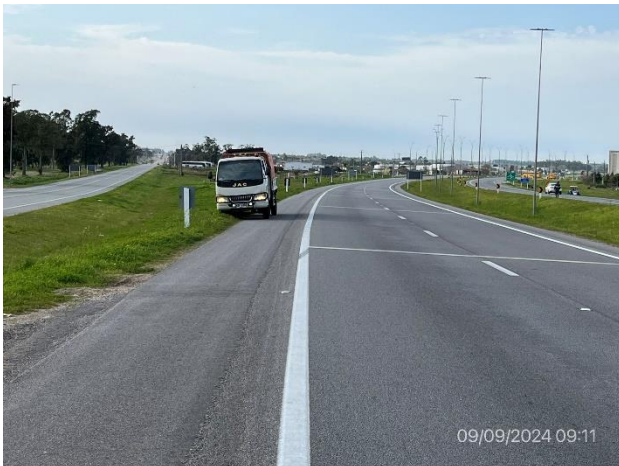
Foto 12.1-3, P05. Frente de obra subcontrato Monerden SA. Ruta 1 progresiva, 54K300.