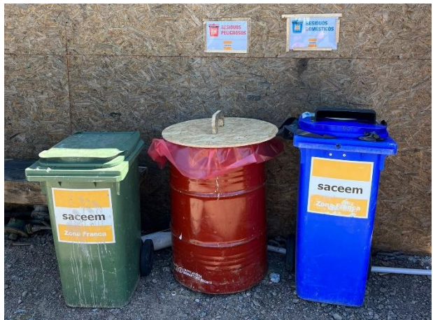
Foto 12.3-5, P04. Se completó la infraestructura para acopio temporal de residuos.