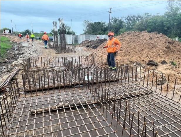
Foto 12.1-7, P02. Acopio de armaduras preconformadas.