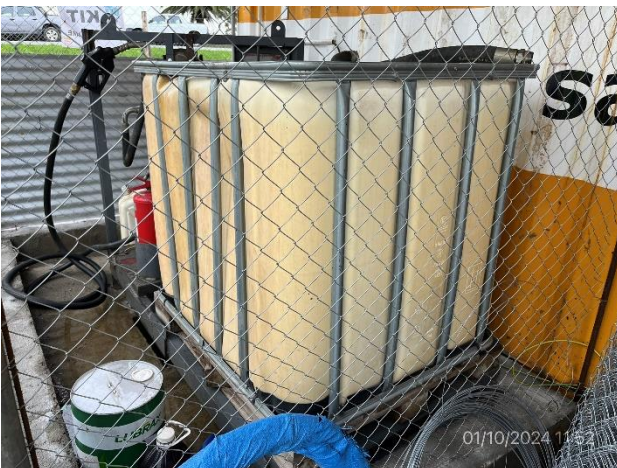
Foto 12.1-17, P03. Campamento principal. Recinto envallado y techado para alojar surtidor de combustible.