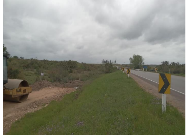
Foto 12.3-2, P03. Se demarcó la cota de máxima inundación.