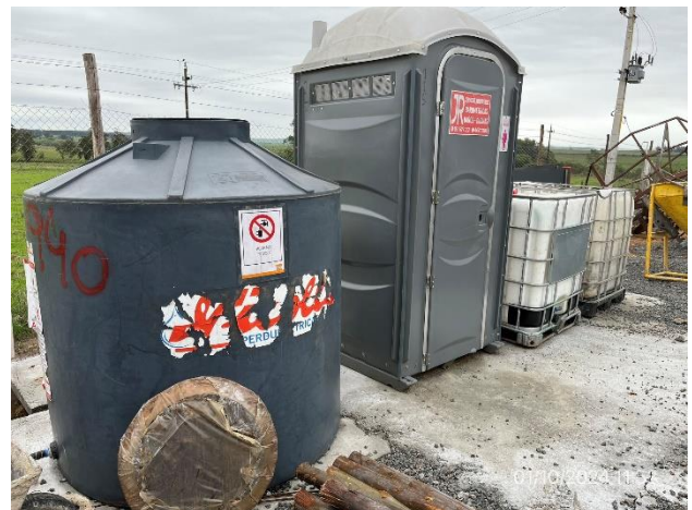
Foto 12.1-18, P03. Campamento principal. Tanque de agua no potable.