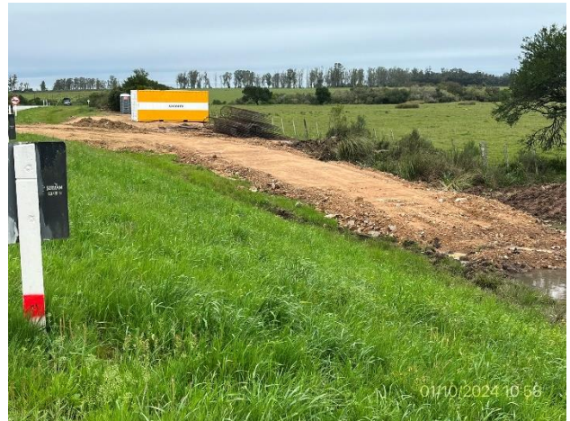
Foto 12.1-4, P01. No está indicada la cota de máxima inundación. Corregido el 07/10/2024.