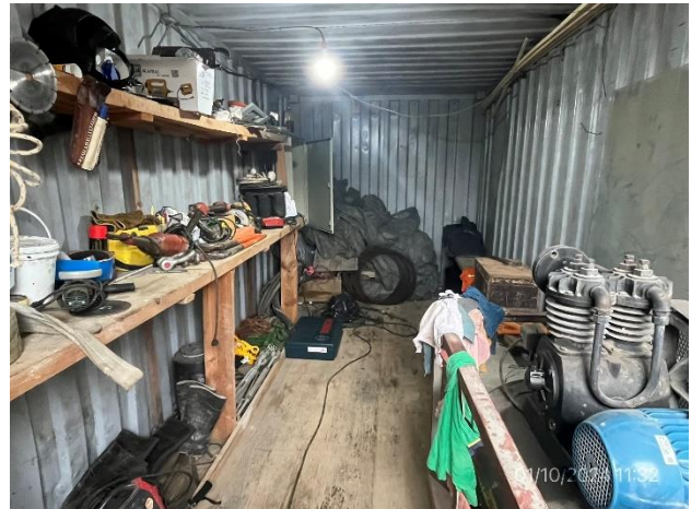
Foto 12.2-4, P04. Pañol en buenas condiciones de orden y limpieza.