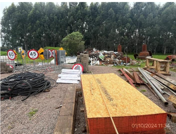
Foto 12.2-5, P04. Explanada de acopio de materiales. No hay separación física con elementos preexistentes propiedad del dueño del predio CIMSA.