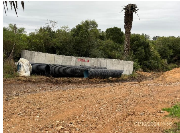
Foto 12.1-10, P03. Acopio de tuberías para entubado del curso de agua.