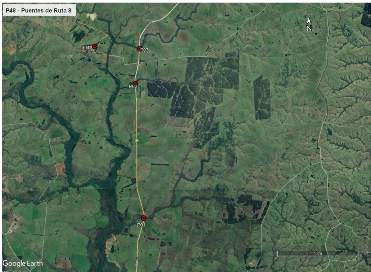
Figura 5-1 Lugares de interés.

Durante la auditoría ambiental se recorrieron los tres puentes de Ruta 8 con sus campamentos provisionales y la planta de hormigón.