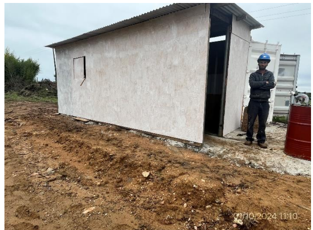
Foto 12.1-6, P02. Campamento móvil sin servicios de bienestar ni tarrinas de residuos. Corregido el 07/10/2024.