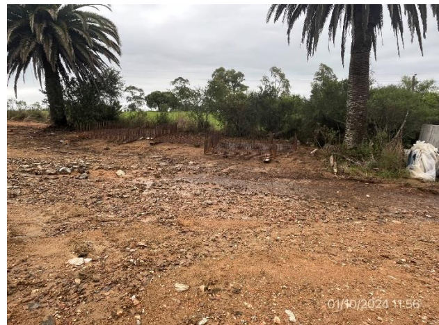
Foto 12.1-12, P03. Acopio de armaduras ensambladas.