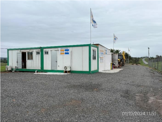
Foto 12.1-13, P03. Campamento principal. Faja pública de Ruta 8, progresiva 307K570 a (-).