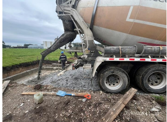
Foto 12.2-2, P04. Pileta de lavado de camiones mixer en construcción.