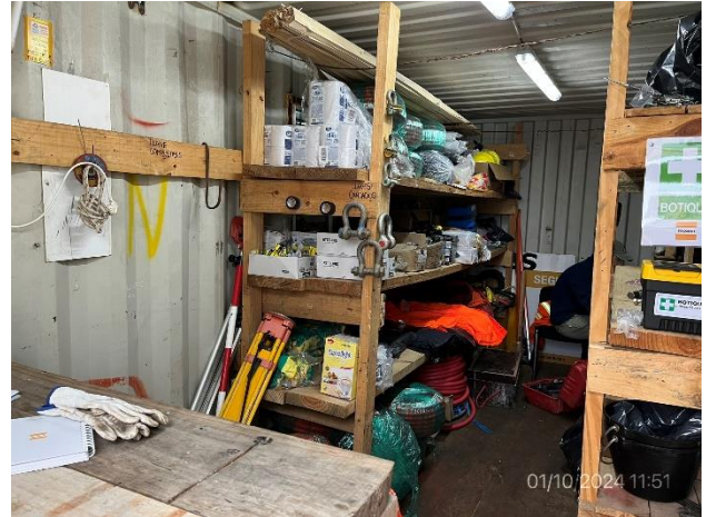
Foto 12.1-14, P03. Campamento principal. Pañol en buenas condiciones de orden y limpieza.