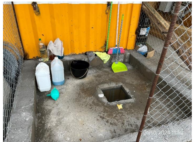
Foto 12.1-16, P03. Campamento principal. Recinto envallado y techado para acopio de hidrocarburos