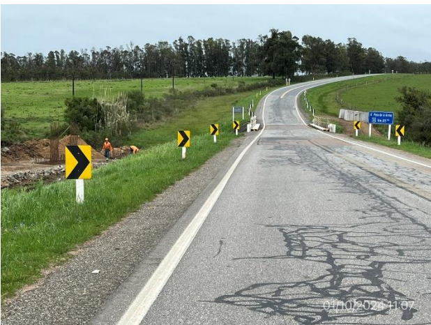
Foto 12.1-5, P02. Nuevo Puente en obra sobre Arroyo Paso de la Arena. Ruta 8 progresiva 305K070.