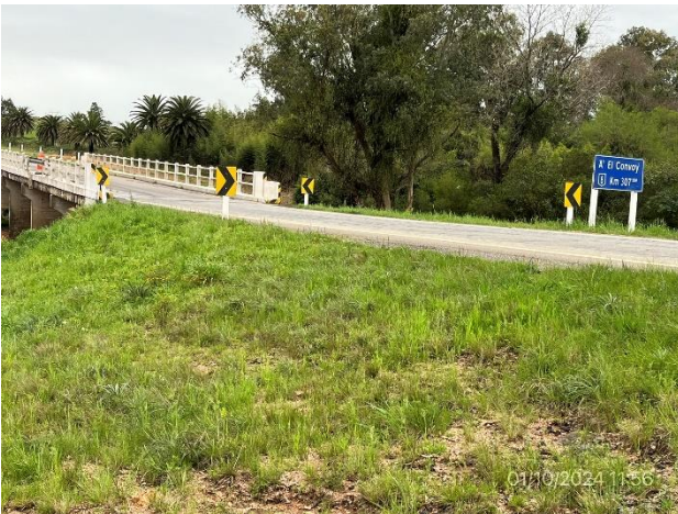
Foto 12.1-9, P03. Nuevo Puente en obra sobre Arroyo El Convoy. Ruta 8 progresiva 307K570.