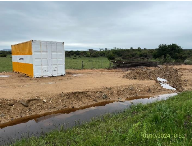
Foto 12.1-3, P01.. Campamento móvil sin actividad.