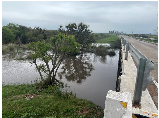
Foto 12.1-2, P01. Especies vegetales en el cauce con tratamiento especial a ejecutar de trasplante y poda