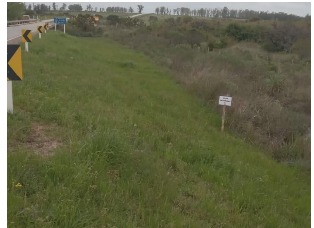
Foto 12.3-4, P02. Se demarcó la cota de máxima inundación.