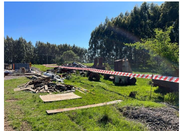
Foto 12.3-6, P04. Se instaló una demarcación física de la zona exclusiva de uso de SACEEM.