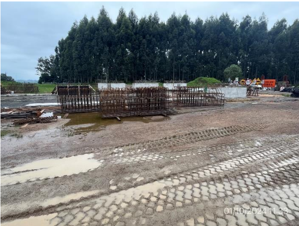
Foto 12.2-3, P04. Explanada para acopio de armaduras