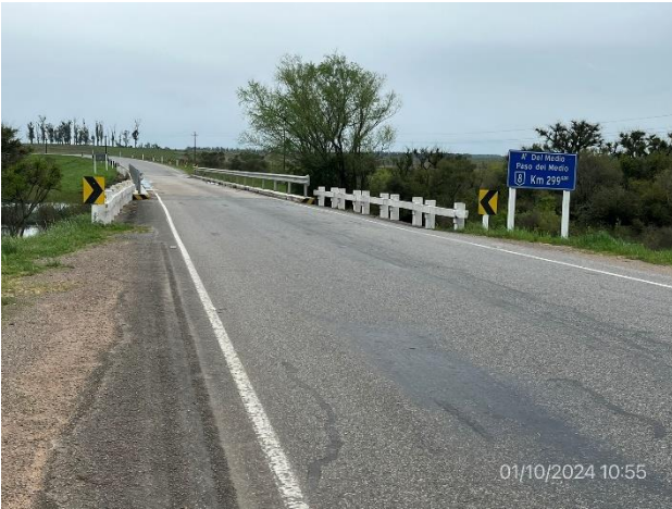
Foto 12.1-1, P01. Nuevo Puente en obra sobre Arroyo del Medio. Ruta 8 progresiva 299K030.