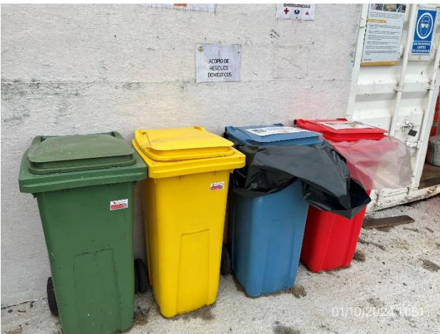
Foto 12.1-15, P03. Campamento principal. Infraestructura acorde al PGA para acopio temporal de residuos.