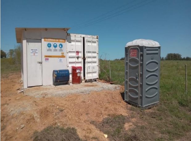
Foto 12.3-1, P02. Campaento móvil. Se instalaron los servicios de bienestar y la infraestructura para acopio temporal de residuos.