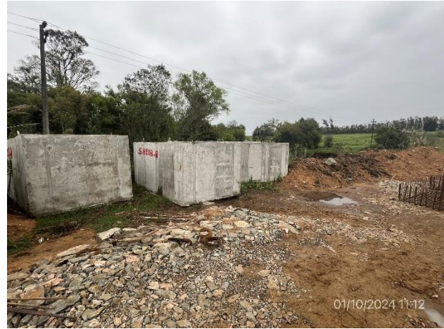
Foto 12.1-8, P02. Acopio de fundaciones tipo Havage. No está indicada la cota de máxima inundación. Corregido el 07/10/2024.