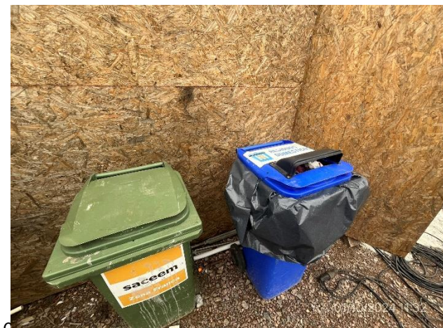
Foto 12.2-6, P04. Infraestructura para el acopio de residuos incompleta. Corregido el 07/10/2024.