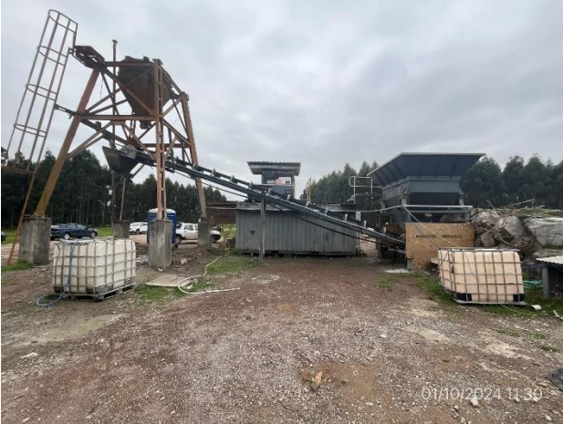
Foto 12.2-1, P04. Planta de hormigón. Padrón N° 10301 de la 4ª. SC de Treinta y Tres, planta industrial de CIMSA.