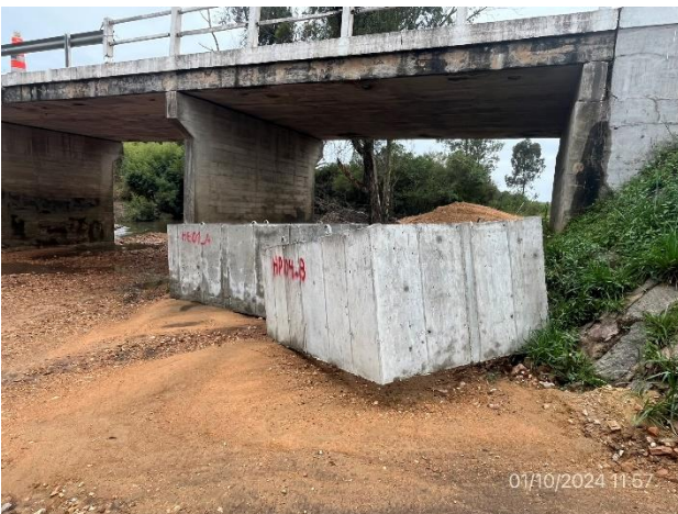
Foto 12.1-11, P03. Acopio de fundaciones tipo Havage. No está indicada la cota de máxima inundación. Corregido el 07/10/2024.