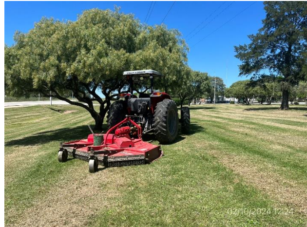
Foto 12.1-2. P05. Frente de obras, mantenimiento de áreas verdes. Ruta 3, progresiva 233K700 a (+) y a (-).