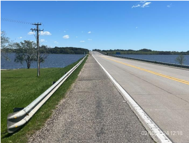
Foto 12.1-1 P02. Fin del tramo. Ruta 3 progresiva 243K000, A° Grande.