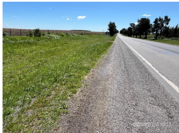
Foto 12.1-4. Ruta 3. Tramo de banquina con mantenimiento realizado.