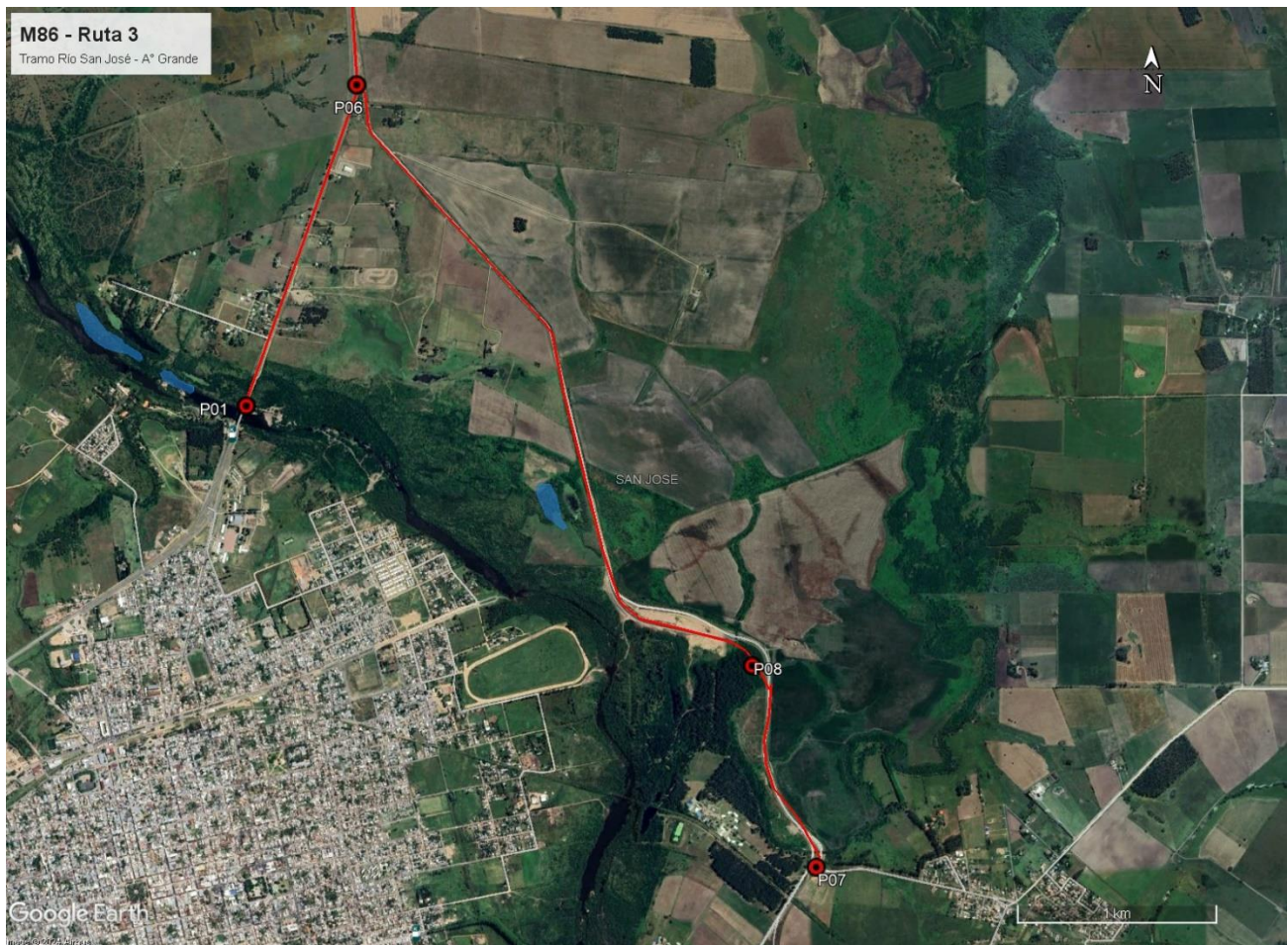
Figura 5-1 Lugares de interés.

Durante la auditoría ambiental se recorrió íntegramente el tramo de Ruta 3 entre el Río San José y el A° Grande, el frente de obras de mantenimiento de áreas verdes y la obra terminada del By-Pass Carreta Quemada próximo a la ciudad de San José.