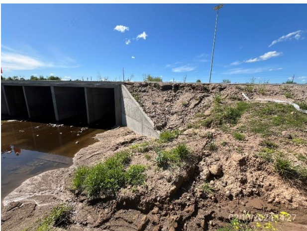
Foto 12.2-5. P08. By Pass Carreta Quemada, alcantarilla. Talud de acceso Este erosionado