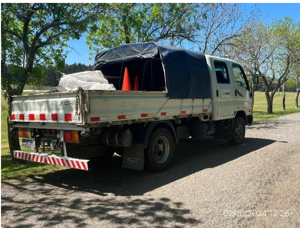
Foto 12.1-3. P05. Camión taller móvil, dotado de elementos adecuados para operación de hidrocarburos.