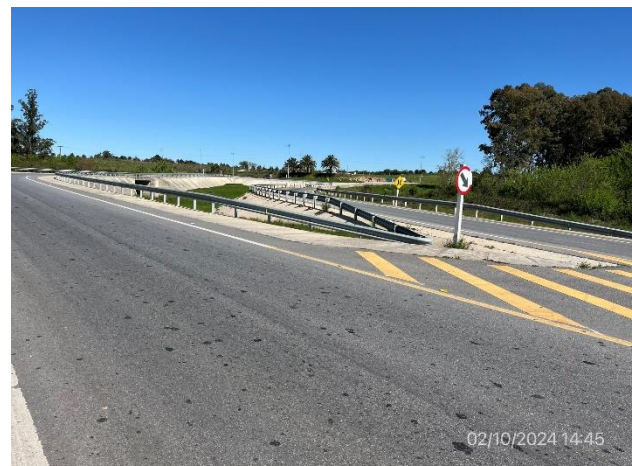
Foto 12.2-6. P07. Fin de tramo, By Pass Carreta Quemada. Empalme con Cno. El Éxodo.