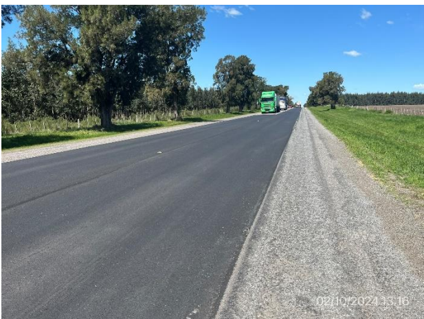
Foto 12.1-5. Ruta 3, recapado terminado en tramos de calzada completa. Falta señalización horizontal.