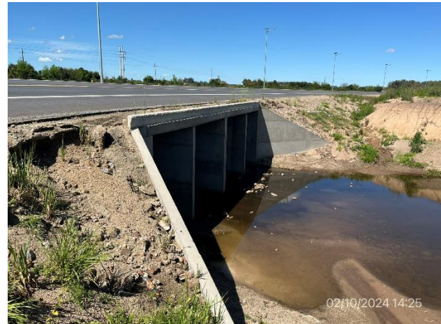
Foto 12.2-4. P08. By Pass Carreta Quemada, alcantarilla. Talud de acceso Oeste erosionado.