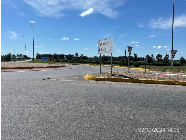
Foto 12.2-1. P06, Inicio de tramo, By Pass Carreta Quemada. Ruta 3 progresiva 96K900.