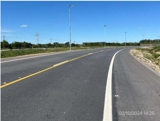
Foto 12.2-3. By Pass Carreta Quemada, ensanche de plataforma ejecutado.