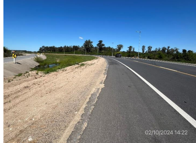
Foto 12.2-2. By Pass Carreta Quemada, ensanche de plataforma ejecutado.