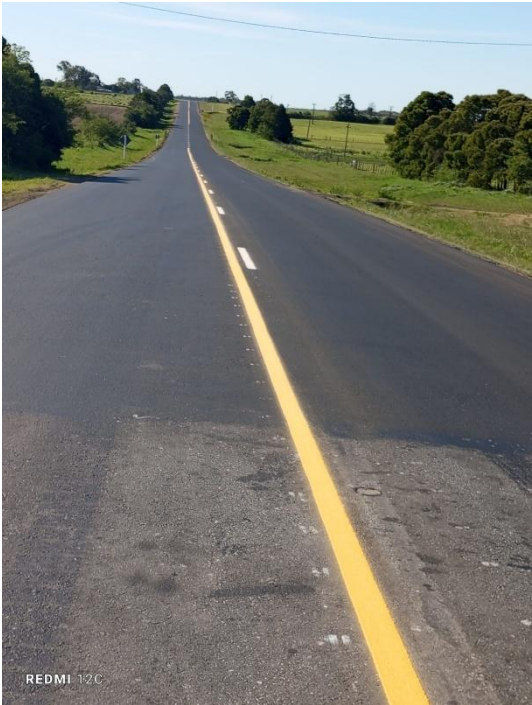
Imagen N°17: Pintura línea de eje blanca y amarilla en recapado ruta 23.