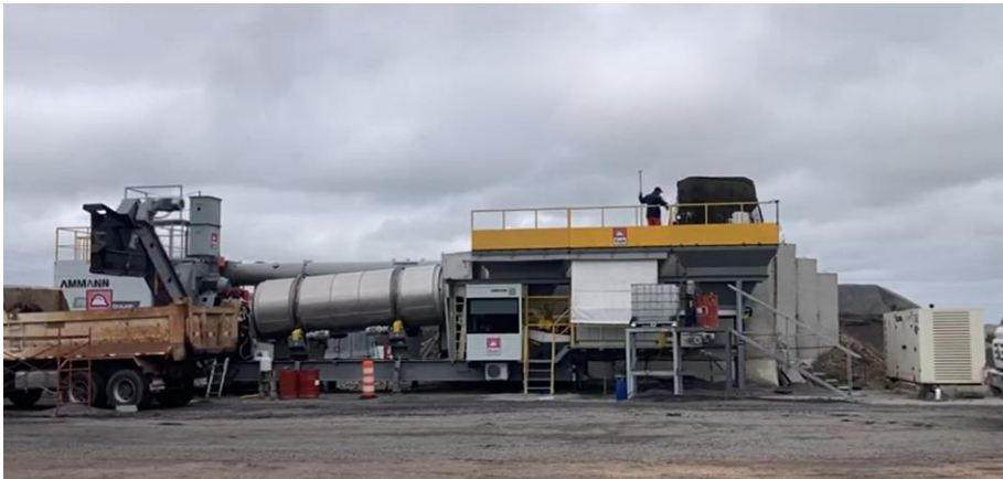
Imagen N°4: Planta asfáltica en funcionamiento para jornada de bache.

Se presentan imágenes del obrador y de los frentes de obra para el trimestre de referencia.