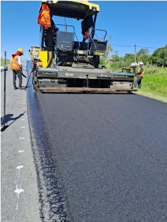
Imagen N°7: Carpeta de rodamiento en recapado ruta 23 (Km 102,500-103,400) (TEM).