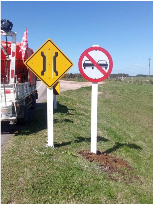
Imagen N°14: Mantenimiento de señalización vertical.