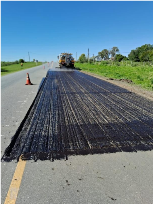
Imagen N°5: Riego de adherencia para el recapado Ruta 23.