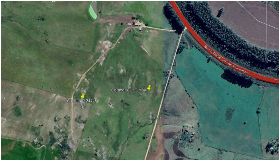
Imagen N°2: Ubicación Cantera padrón N° 24448 Colonia.

Se cuenta con otra cantera de obra pública de material granular ubicada en el padrón 16683 de San Jose (la habilitación de Ministerio de ambiente se adjuntó en el 3er ITGA) y la inclusión de obra pública se adjuntó en el 4to ITGA.