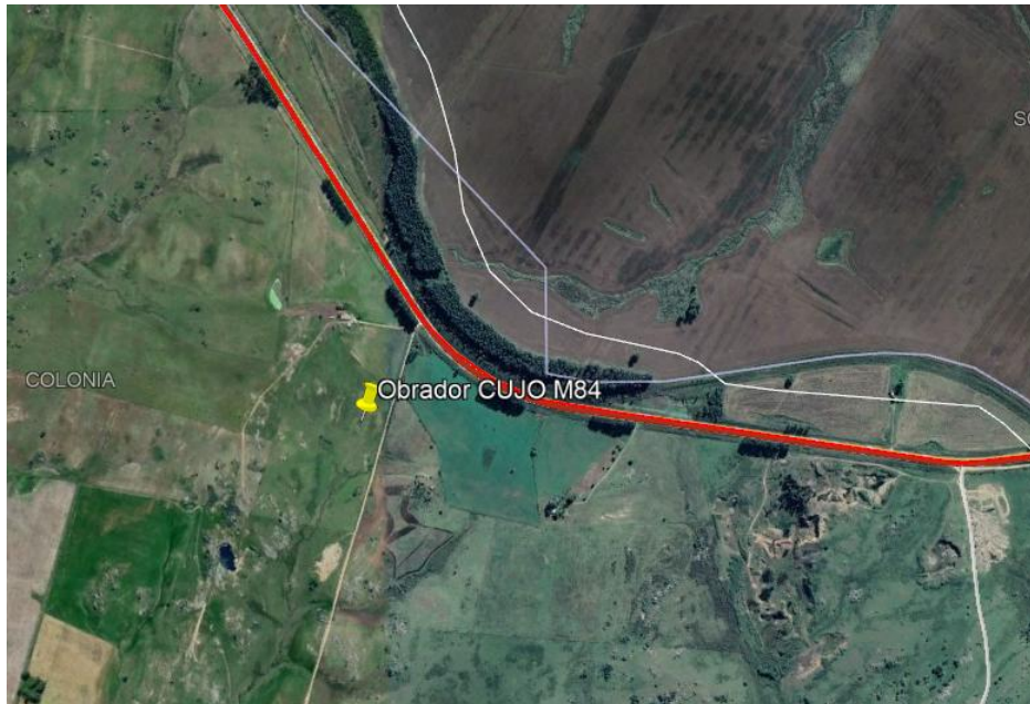
Imagen N°1: Ubicación del obrador.

En el presente trimestre en el frente de obra se ejecutaron las tareas de: