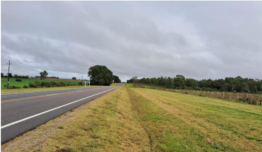
Imagen N°12: Mantenimiento de la faja ruta 23.