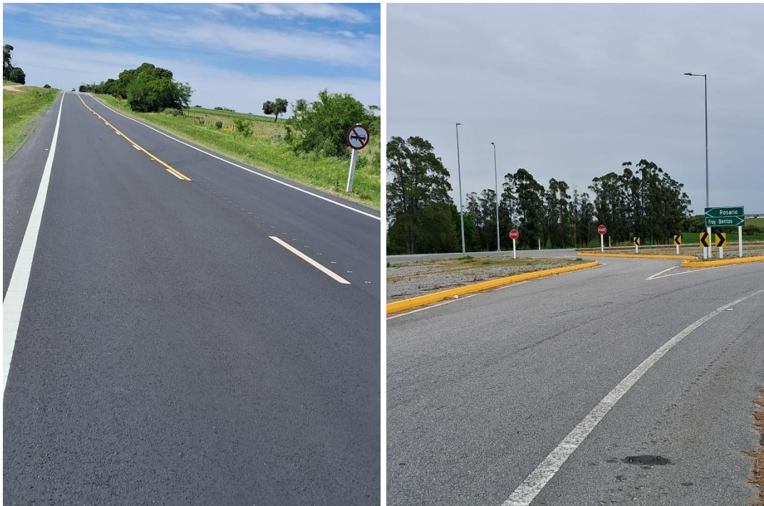
Imagen N°15: Pintura borde blanca con resalto ruta 23. Imagen N°16: Pintura en cordones de canteros en ramal Benítez Ruta 2.