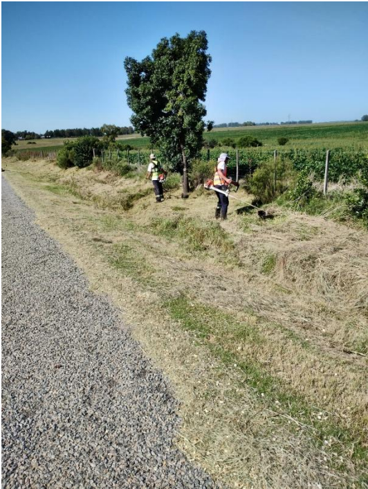
Imagen N°13: Mantenimiento manual con bordadoras en Ruta 2.