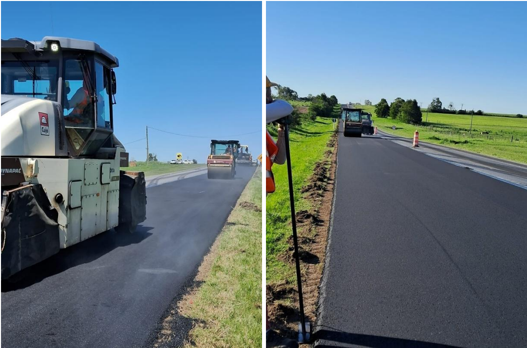
Imagen N°8 y 9: Compactación carpeta de rodamiento recapado ruta 23. Tareas extraordinarias de mantenimiento (TEM).