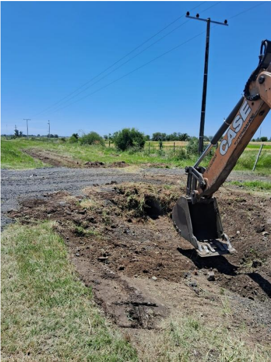
Imagen N°10 Y 11: Mantenimiento de alcantarillas y cunetas ruta 2.