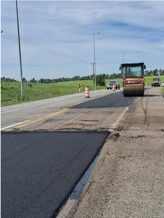
Imagen N°6: Bacheo parcial en ruta 2. Tareas extraordinarias de mantenimiento (TEM).